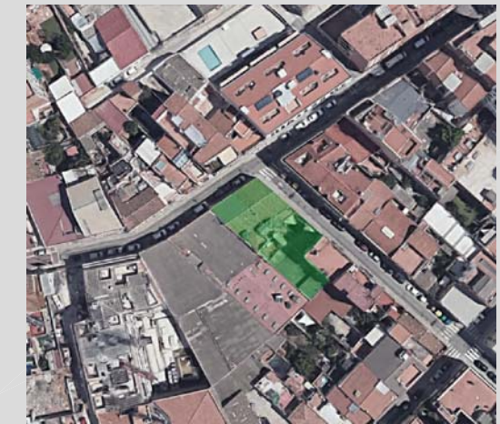
C/ Vila i Vilà, n 35-37, Gavà (Barcelona)